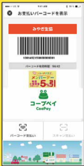
コープペイバーコード画面