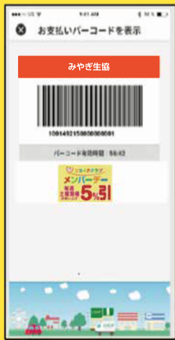
現金・その他バーコード画面