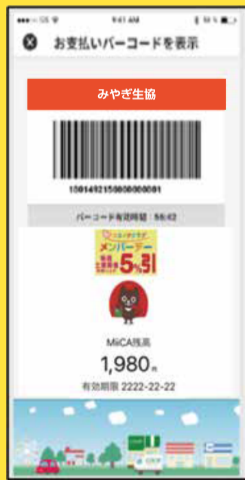
MiiCAカードバーコード画面