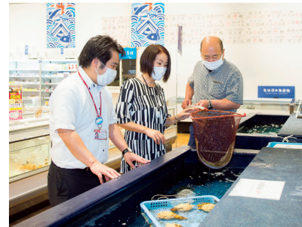
大きなけいすもあり、漁師から直接仕入れている新鮮な魚介類を購入することができる

国道45号を挟んで目の前に太平洋が広がる道の駅大谷海岸。震災後の仮設店舗営業から、今年3月にモダンな建物でリニューアルオープンしました。道の駅のテーマは「オール気仙沼」。気仙沼ならではの魅力を詰め込んだ施設になりました。